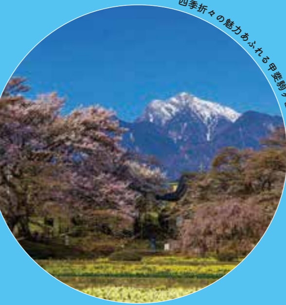
四季折々の魅力あふれる甲斐駒ヶ岳@山高神代桜